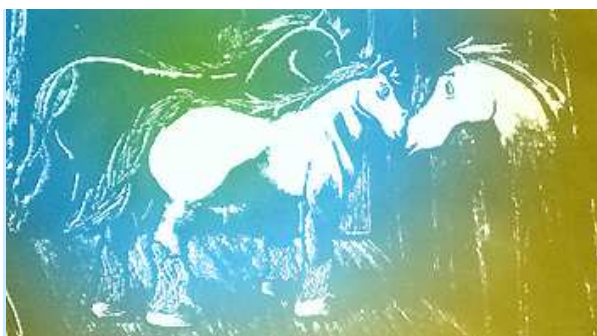
Il Cavallo messo a lato è un Cavallo dimezzato!

Il Cavallo laterale tante volte porta male!